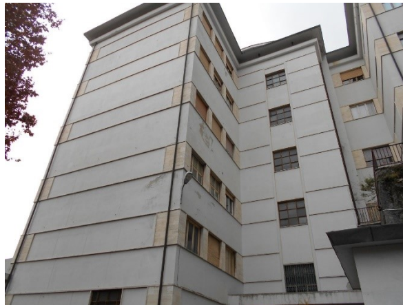
Figura 1.1 - Particolare della facciata principale

L’involucro edilizio opaco che costituisce l’edificio è composto da murature portanti costituite prevalentemente da mattoni pieni. La copertura dell’edificio è piana, costituita da blocchi di laterizio più calcestruzzo e materiale impermeabile, e viene sfruttata come terrazza a livello del primo e del terzo piano, mentre al quinto piano viene sfruttata come ingresso principale. Dove è possibile viene anche usata anche la conformazione del terreno a livello del primo piano, così di fatto il piano terra diventa parzialmente seminterrato.