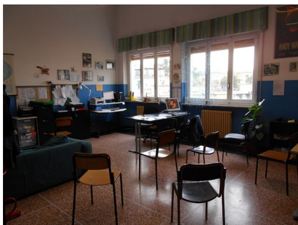
Figura 2.2 - Particolare dei serramenti