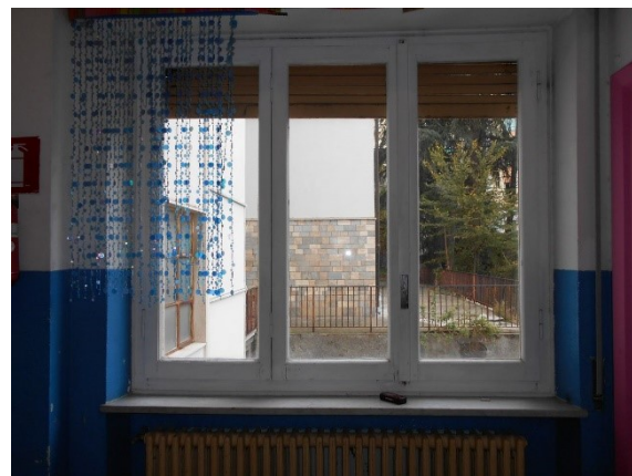
Figura 2.1 - Particolare dei serramenti