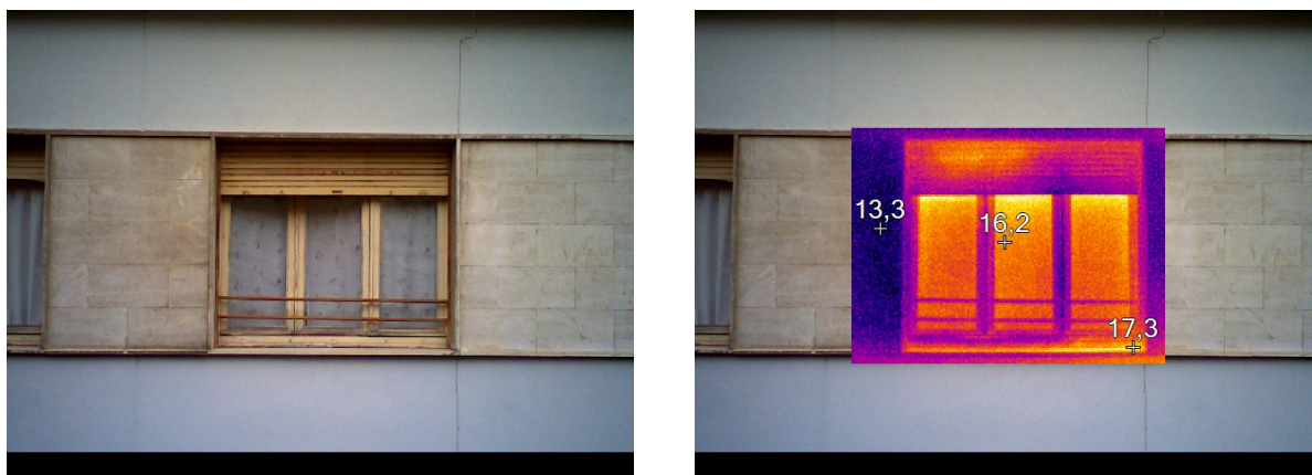
Figura 2.4 – Rilievo termografico dei serramenti